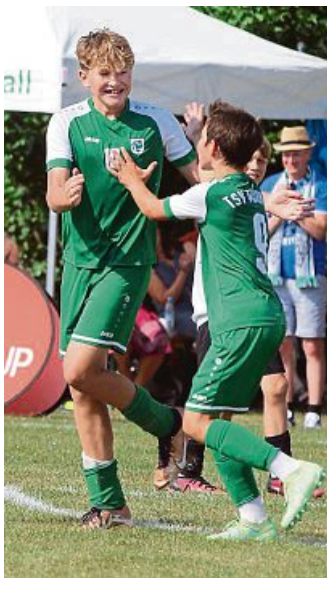
Grün jubelt: Die Murnauer E-Jugend feiert den Sieg.