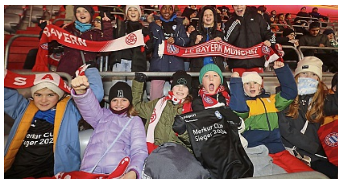
Beste Stimmung auf den Rängen.