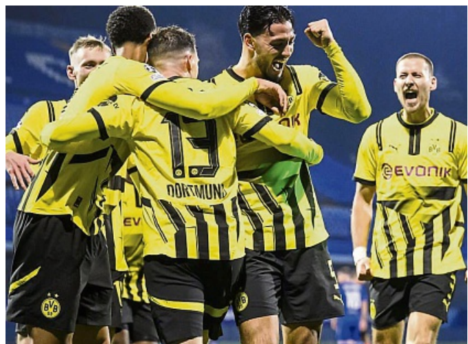
In Zagreb feierte der BVB mal wieder einen Auswärtssieg.

Der VfB reagierte einen Tag nach dem 1:5 empört. „Solche Zustände sind nicht hinnehmbar“, wurde der Stuttgarter Vorstandsvorsitzende Alexander Wehrle in einer Mitteilung des Vereins zitiert: „Wir wollen den Fußball in einem freizügigen Europa erleben. Stattdessen sehen wir uns immer häufiger mit unverhältnismäßigen Maßnahmen gegen Fans, Vorverurteilungen, Schikanen und nun offenbar sogar mit Gewaltanwendung und Erniedrigungen konfrontiert.“ Der Verein kündigte an, bei der UEFA Protest einzulegen.