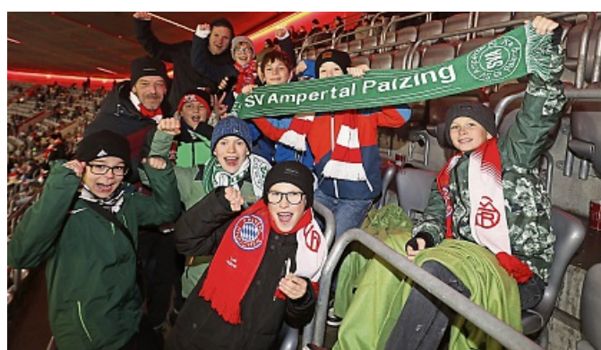
Der SVA Palzing jubelnd in der Allianz Arena.