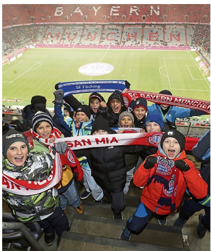
Überglücklich: Die Kids des SF Föching.