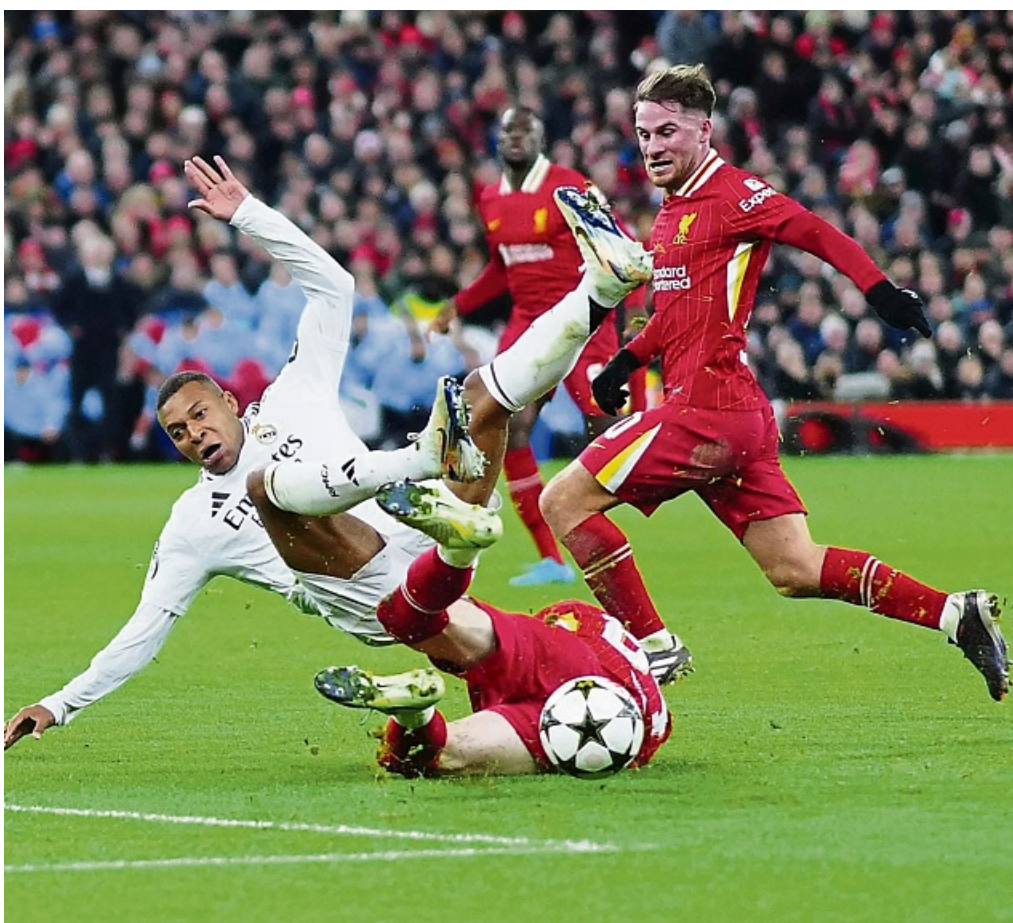
Sauber abgeräumt: Kylian Mbappé.

„Ich denke, dass es eng wird fürs Wochenende“, sagte Trainer Nuri Sahin. „Er ist extrem wichtig für unser Spiel. Wir hoffen, dass es nur eine Zerrung ist.“