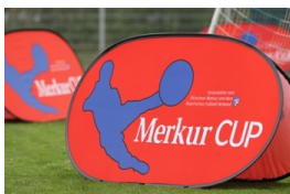
POP UP – Muster

Um die beiden Kleinspielfelder und auch in der Coachingzone stellt der Ausrichter POP UPs vom Merkur CUP und seinen Partnern ESB, uhlsport und Mauritz-Pokale nach folgendem Aufstellplan.