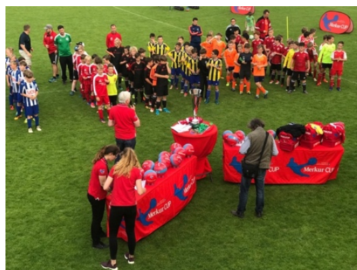
Tischaufbau zur Siegerehrung

Für die Siegerehrung werden Pokal und Biertische wie im Bild aufgebaut, die Mannschaften stehen davor.