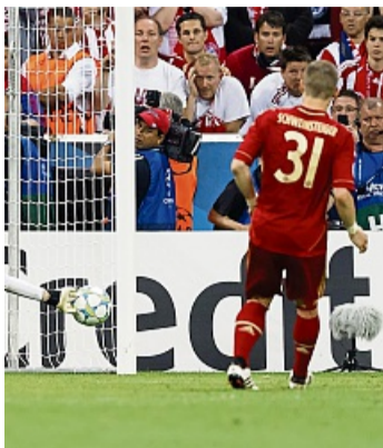
Schweinsteiger traf 2012 nur den Pfosten.

Es sieht alles nach einem Erfolg von Atlético Madrid aus. Doch ausgerechnet Katsche beim „Klassenkampf“ ist die hohe Politik Thema – und auf