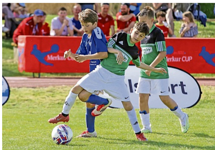
Nur knapp mit 1:0 gewannen die Weidacher ihr Platzierungsspiel gegen Thanning.