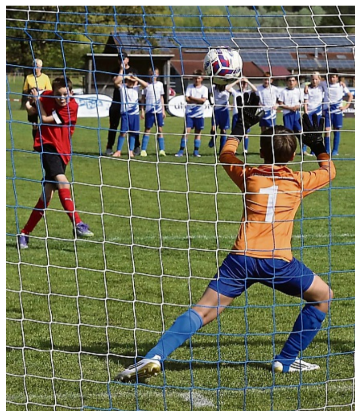
Die Nerven behalten war die Devise beim Acht-Meter-Schießen, wie hier im Duell zwischen Gastgeber SV Eurasburg-Beuerberg und dem TSV Schäftlarn.