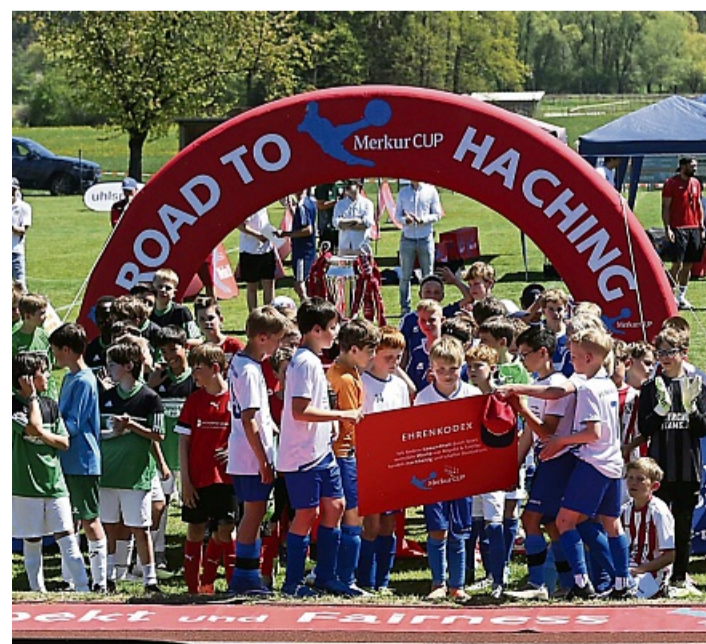
Bei der Begrüßung wurde von den Fußballern der Ehrenkodex der Merkur CUP-Turnierserie vorgelesen.