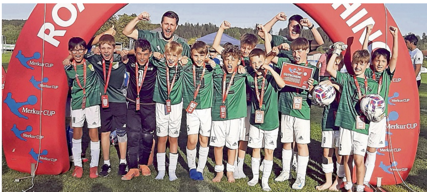
Souveräner Turniersieger wurden die Waldramer E-Junioren, die zudem auch noch den erstmals ausgetragenen Torwand-Wettbewerb gewannen.