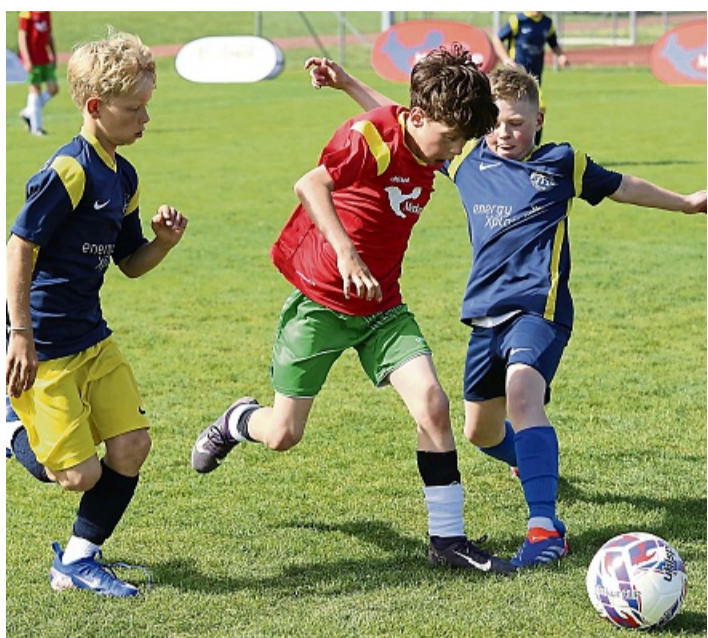
Im Gruppenspiel setzten sich die FF Geretsried (blau) knapp mit 2:1 gegen die FA Thanning durch.