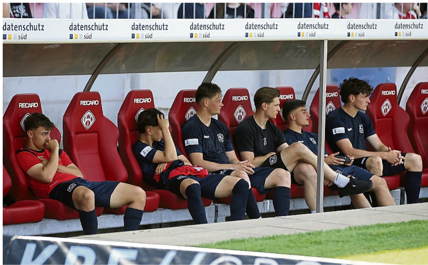
Die Gesichter sprechen Bände: Hachinger Spieler sitzen enttäuscht auf der Reservebank in Würzburg.