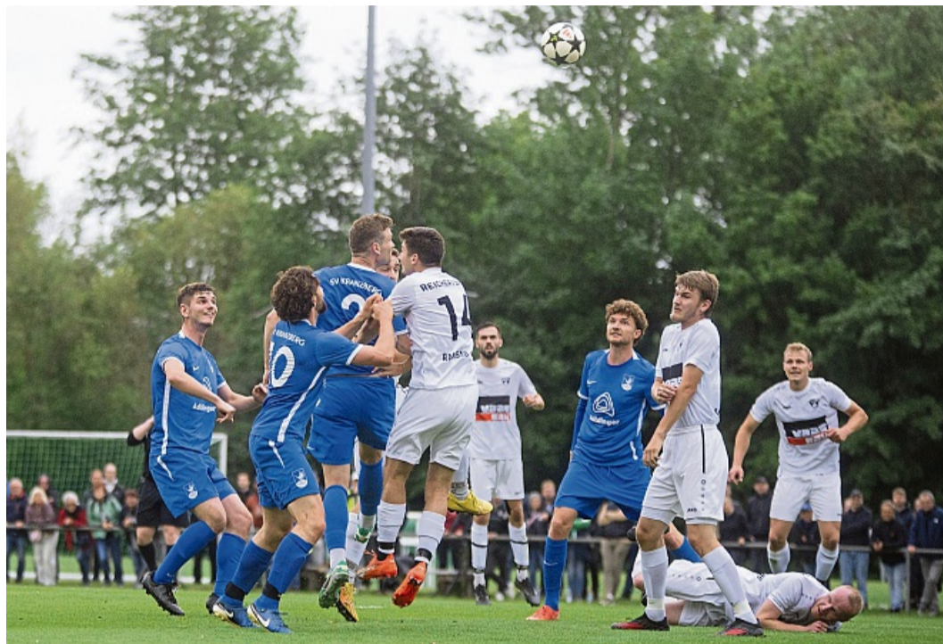
Rudelbildung unter der Lederkugel: In der Relegation zwischen Kranzberg und Reichertsheim ging es ordentlich zur Sache. Ein Sieger konnte allerdings nicht ermittelt werden.