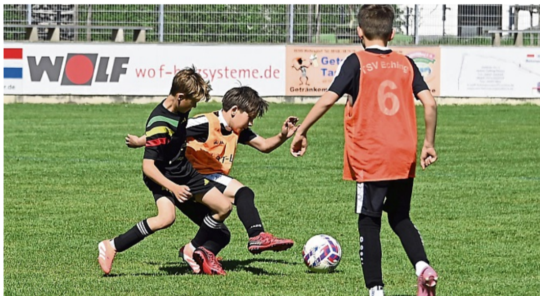
Heiße Kandidaten für das Halbfinale sind die Kicker vom SVA Palzing (schwarz) und dem TSV Eching (rote Leibchen). BAUER

Die wahren Endspiele sind ab 12.45 Uhr die Halbfinals. Denn: Die Sieger dieser Partien haben