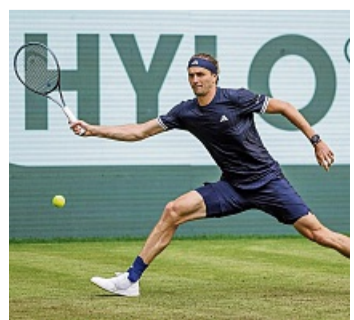
Auf Rasen hat Zverev seine Probleme.

In diesem Jahr könnte Zverev von den Problemen der Konkurrenz profitieren. Aber dafür braucht es eine Steigerung. sid