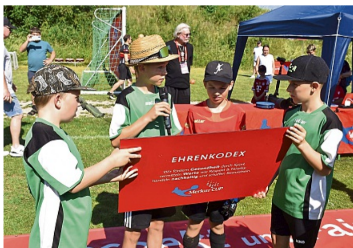
Fairness wird beim Merkur CUP großgeschrieben: Die Spieler der Gastgeber verlasen den Ehrenkodex.