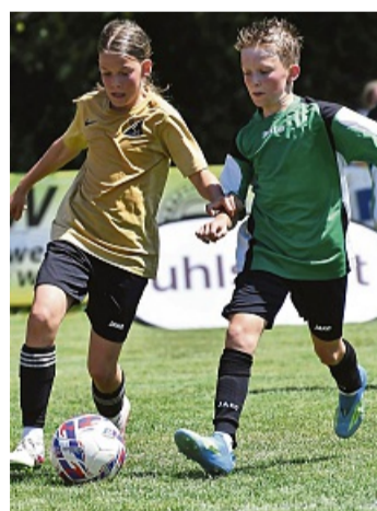
Im Spiel um Platz drei behielten die Mammendorfer (in Gelb) die Oberhand.