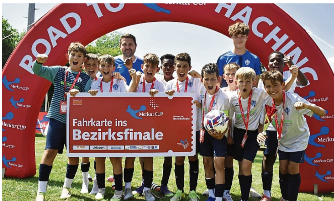
Als Turniersieger jubelte der favorisierte SC Olching.