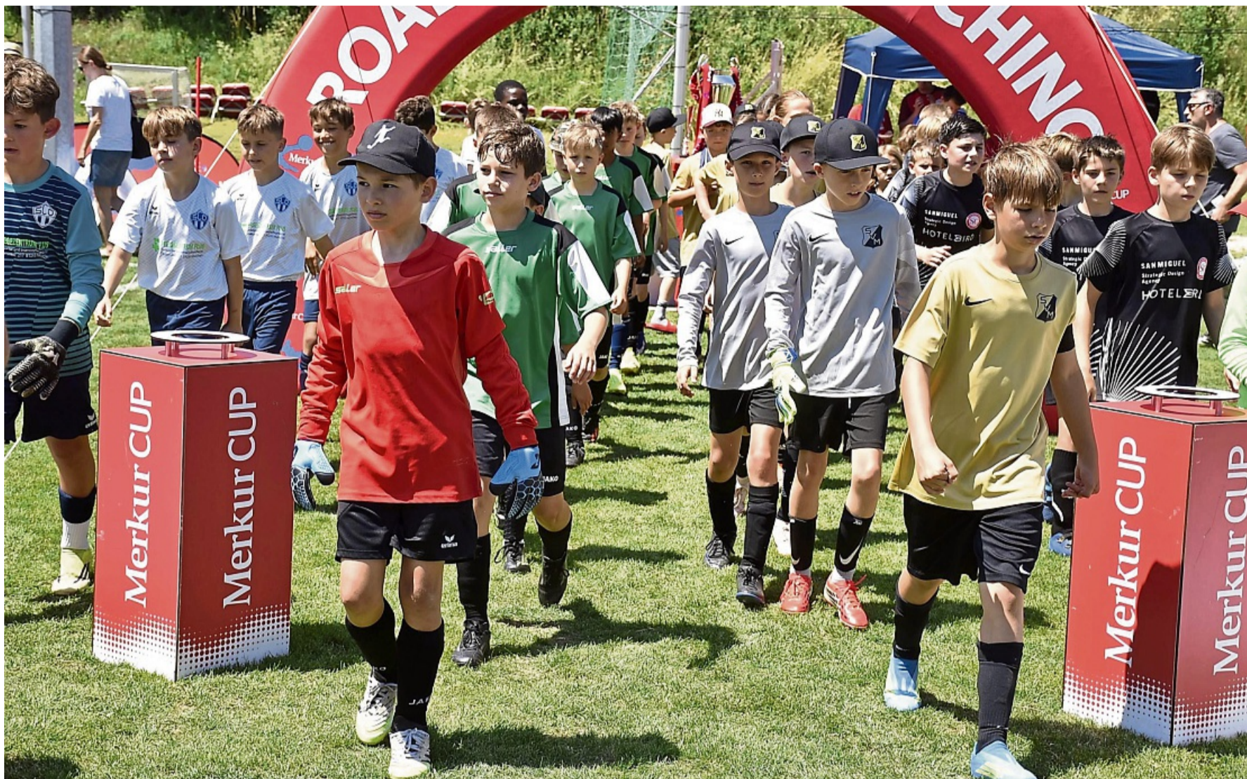
Bereit für spannende Spiele: Die vier Halbfinalisten (v.l.) SC Olching, SG Jesenwang, SV Mammendorf und SC Unterpfaffenhofen laufen ein.