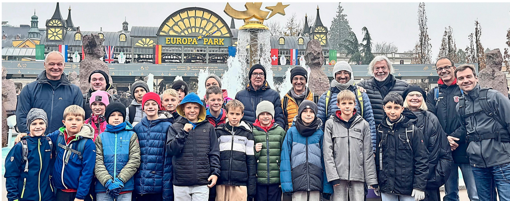
Geschwindigkeit, Adrenalin und jede Menge Spaß: Für viele U11-Kicker des SV Erpfting waren die Achterbahnen des Europaparks das Highlight der Fußballreise nach Freiburg.