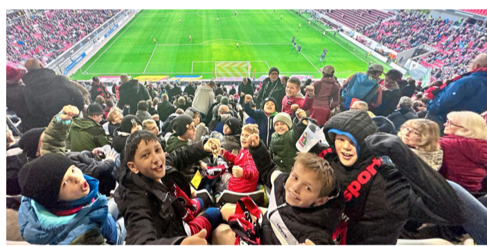
Zum krönenden Abschluss ging es ins Freiburger Stadion zum Bundesligaspiel gegen St. Pauli.