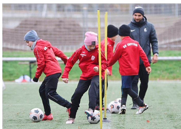
Schwitzen im NLZ: Der SV Erpfting absolvierte mit einem Trainerteam des SC Freiburg eine intensive Einheit.