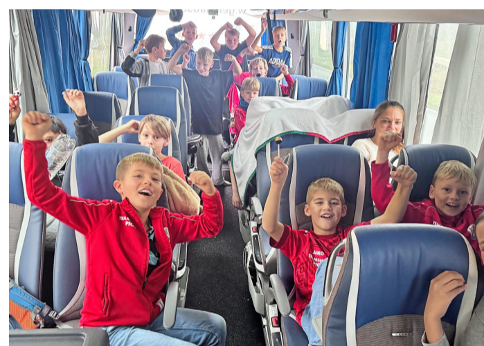
Im Bus von Geldhauser ging es für die ESB-Fairplaypreisgewinner des Merkur CUP ins Breisgau.