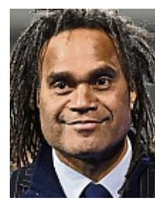
Christian Karembeu Ein Weltmeister fiebert mit

„Ich hoffe, unsere Spieler zeigen, was in ihnen steckt“, sagte Karembeu in einem FIFA-Interview vor dem Playoff-Turnier in