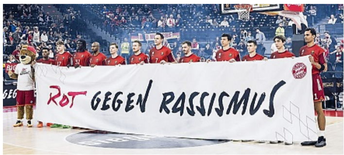
„Was für eine Gesellschaft wollen wir sein?“ Hainer lebt „Rot gegen Rassismus“ vor. IMAGOWUNDERL