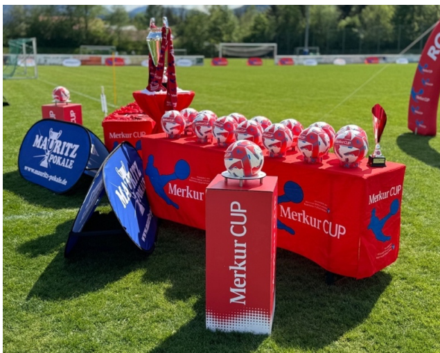
Aufbau der Tische zur Siegerehrung

Für die Siegerehrung werden Pokal und Biertische wie im Bild aufgebaut, die Mannschaften stehen davor.