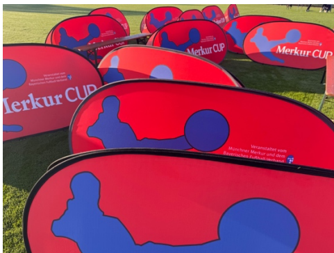
POP UP – Muster

Um die beiden Kleinspielfelder und auch in der Coachingzone stellt der Ausrichter POP UPs vom Merkur CUP und seinen Partnern ESB, uhlsport, Bayern-Park, Geldhauser und Mauritz-Pokale gemäß folgendem Aufstellplan.